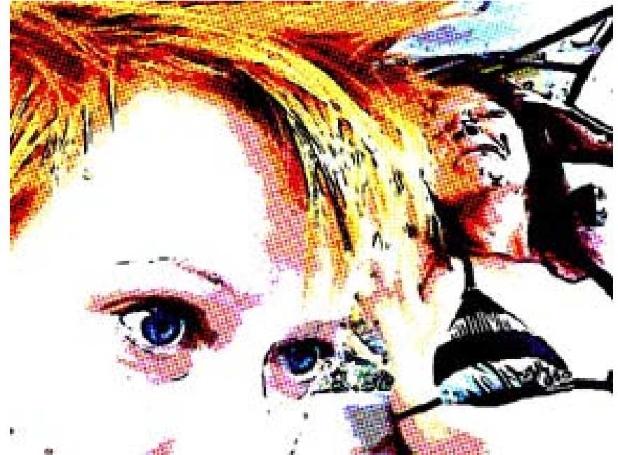
... AUS DEM COMPUTER