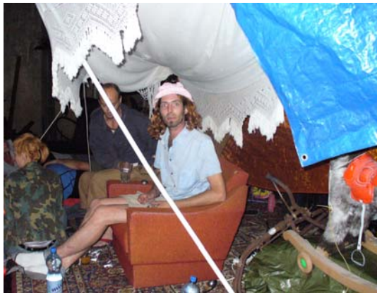
ZAPPAS ASTRALKÖRPER SCHLUCKT FAUN!